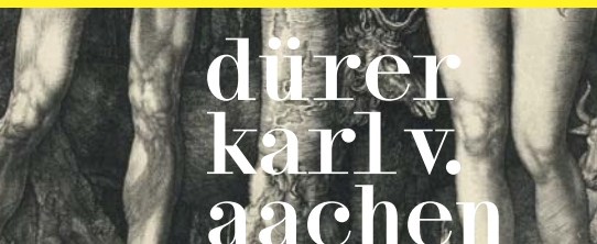
Albrecht Dürer, Adam und Eva, Adam and Eve, 1504, Rijksmuseum Amsterdam

In 1520, two important historical figures journeyed to Aachen: Charles V, who was to be ceremonially crowned in Aachen Cathedral; and Albrecht Dürer, one of the greatest artists of his time. Dürer wanted to persuade the freshly crowned monarch to renew the imperial privileges the artist had forfeited.