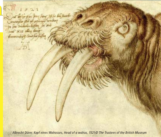
Albrecht Dürer, Kopf eines Walrosses, Head of a walrus, 1521

Johannes-Paul-II.-Straße 1 | 52058 Aachen | Tel.: +49 241 432-4998 museumsdienst@mail.aachen.de